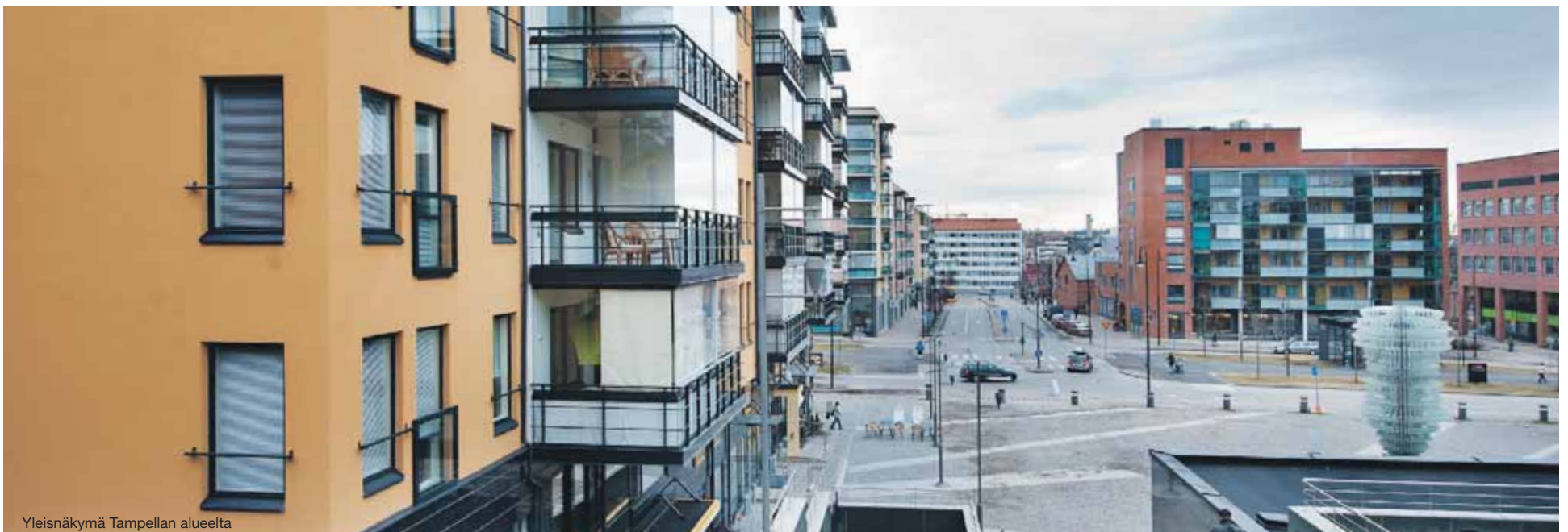
Yleisnäkymä Tampellan alueelta