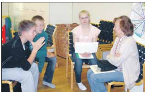
Nuoret ja varamummo juttelevat mediakasvatuksesta.

kaisen hoitopaikan 45 lapselle viikoittain.