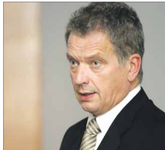
Sauli Niinistö esitti seminaarivälillä oman arvionsa taantumasta ja sen seurauksista.