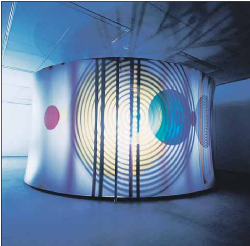
Sara Hildénin taidemuseo tarjoaa valoa kaamokseen Flash!-näyttelyssä. Kuvassa Olafur Eliassonin teos The Inverted Panorama House , 2004.

Tampere-talossa tulee tammikuussa ensi-iltaan yhteistyössä Tampereen Komedioteatterin