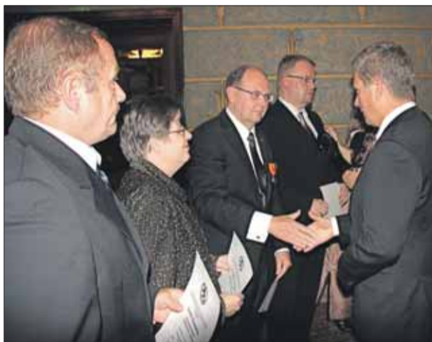
Eduskunnan puhemies Sauli Niinistö jakoi ansiomerkkejä aktiivisille toimijoille.