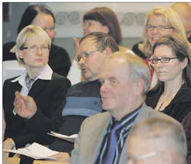
Ennen kokouksen alkua salissa oli rento tunnelma.